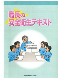
中央労働災害防止協会編 職長の安全衛生テキスト 800円(税別)

右記のテキストをお持ちでない方は当日お渡ししますのでお申し込みください。 研修費にプラスして請求させていただきます。 昼食は各自ご用意ください。近辺に食事のできる場所が多くございます。 また研修室内でもお召し上がりいただけます。