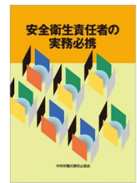
中央労働災害防止協会編 安全衛生責任者の実務必携 700円(税別)